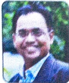
उपाध्यक्ष श्री. नरेंद्र गुरुव