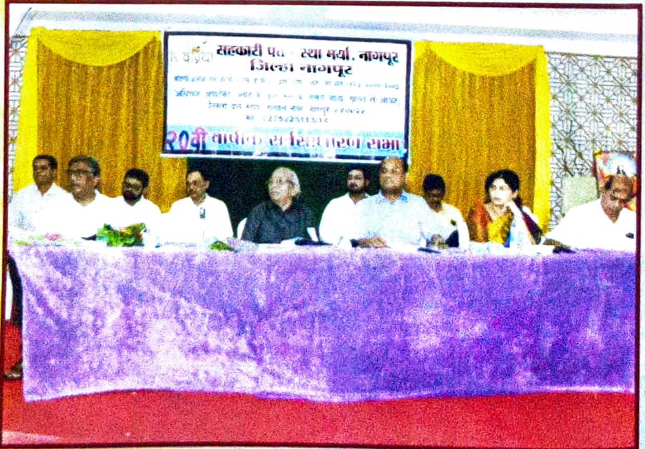
व्यवसापिठावर विराजमान असलेले संचालक मंडळ