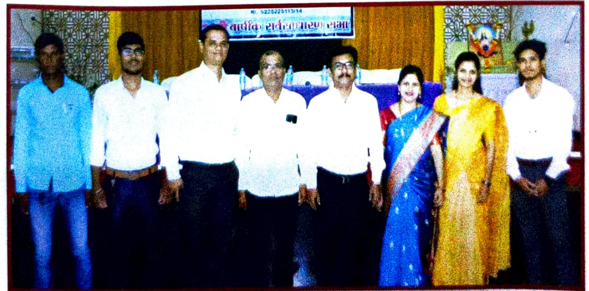
संस्थेचे कर्मचारी व व्यवसाय प्रतिनिधी