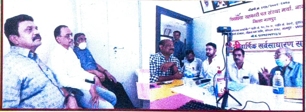
१९ वी ऑनलाईन सभेचे अहवाल वाचन