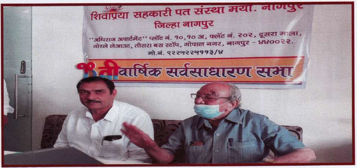
ऑनलाईन प्रश्नोत्तरे ११ वी वार्षिक सर्वसाधारण सभा