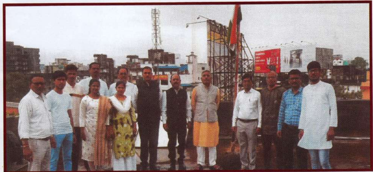
स्वातंत्र्यांचा अमृत महोत्सव प्रसंगी (१५-८-२०२२)