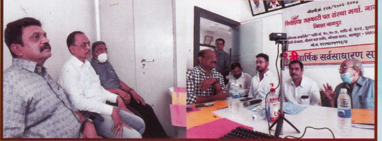
९१ वी ऑनलाईन सभेचे अहवाल वाचन