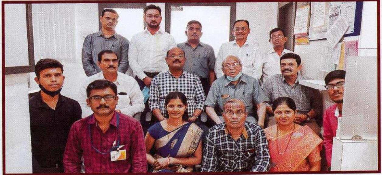
संस्थेचे संचालक व कर्मचारी (११ वी आमसभा)