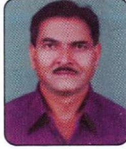
उपाध्यक्ष श्री. किशोर भागडे