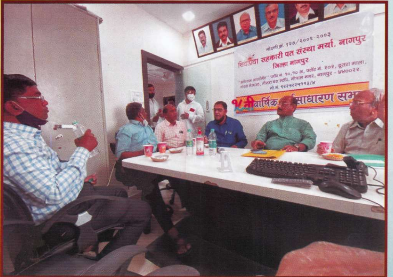
९१ व्या ऑनलाईन सभेचे आभार प्रदर्शन / समारोप